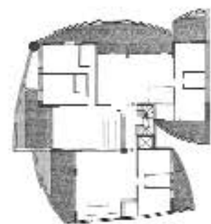
Κάτοψη Δ', Ε', ΣΤ ορόφου